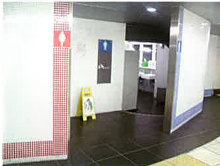
大手鉄道会社の駅トイレでも