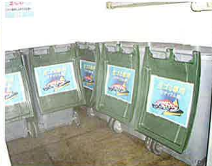
生ゴミを置くスペースの清掃にも